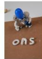
de ballon is van ons